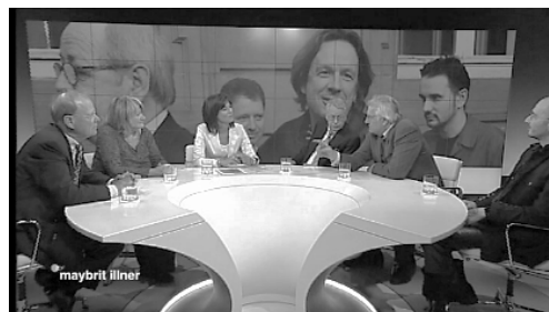
Abb. 5: Bildwand 4