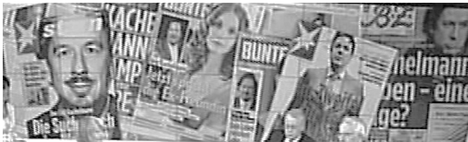
Abb. 10: „Fotostrecke“

Im Folgenden soll noch einmal an einem Beispiel illustriert werden, wie man das transkriptive Potenzial der Bildwand-Elemente im Rahmen einer Betrachtung von Frames erfassen kann.