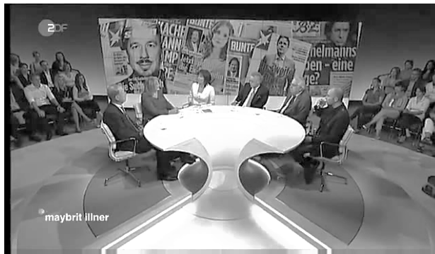
Abb. 2: Setting der Maybrit-Illner-Sendung vom 26.5.2011 (mit Bildwand 1)

Flaggschiff, die donnerstägliche sehr erfolgreiche Polit-Talkshow „Maybrit-Illner“, mit einem neuen Setting versah (s. Abb. 2). Dazu wurde die Sendung aus dem Innenhof des Berliner ZDF-Gebäudes in ein Studio verlegt; anstelle der sichelförmigen Sitzanordnung ohne Tische wurde ein großer runder Tisch mit einem vorderen offenen Sektor installiert. Die Zahl der Kameras wurde auf sieben erhöht: vier fahrende, eine Steadycam (5), ein Kran (6), eine von der Decke hängende (nur für den Schuss auf Maybrits Tablet, auf dem sie Einspieler startet) (7). Die größte Herausforderung für die Regie war aber eine neue Projektionswand im Hintergrund, die ständig mit zusätzlichem Bildmaterial bespielt wird: insgesamt eine gesteigerte Komplexität der Gesamtinszenierung.