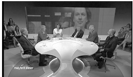
Abb. 4: Bildwand 3