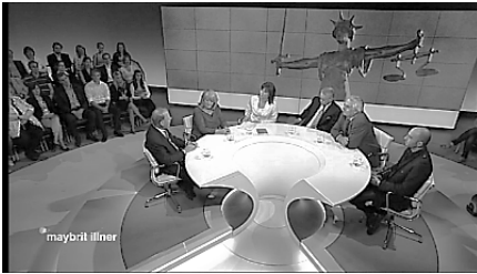
Abb. 6: Bildwand 5

Weitere zwei Bilder sind unterschiedlicher Natur (Abb. 6–7). Das eine zeigt die Justiz allegorisch, vom Regisseur kurz iustitia genannt (Bildwand 5), das andere die Hauptfigur eines mehr oder weniger ähnlichen Falles, den französischen Politiker Dominique Strauss-Kahn, intern als DSK vor Gericht bezeichnet (Bildwand 6).