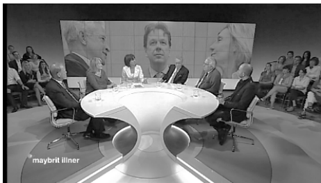
Abb. 3: Bildwand 2

Drei weitere Bilder zeigen den Haupt-Protagonisten des Themas, Jörg Kachelmann, in verschiedenen Situationen; sie werden vom Regisseur folgendermaßen identifiziert (Abb. 3–5): son Kachelmann-bild, Kachelmann mit verteidigung (Bildwand 2); des andere Kachelmann-bild, nur kachelmann (Bildwand 3); Kachelmann abgeführt (Bildwand 4):