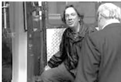
Abb. 9: Der Mannschaftswagen

den Beleg für die These von der Wirkmächtigkeit von „Bildpolitik“ in spektakulären Prozessen. Mit dem Konkretum „Mannschaftswagen“ wird ein Frame aufgerufen, der sofort die Aufmerksamkeit auf ein Bild lenkt, das intern „Kachelmann abgeführt“ heißt. Dabei muss das Bild, das inzwischen überall bekannt war, den Auslöser ‚Mannschaftswagen‘ selbst gar nicht mehr zeigen, weil man aus den Fernsehbildern des gesamten Diskurses weiß, dass dieser links vom gezeigten Bildausschnitt stand (s. Abb. 9). Im Übrigen war in der Sendung die vollständige Szene auch noch einmal in einem Spielfilm zu sehen.