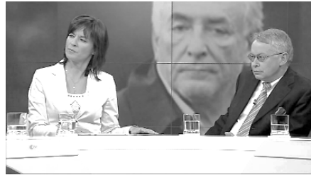
Abb. 7: Bildwand 6

Stellt man sich zunächst die Frage, wie es dazu kam, dass gerade diese Bilder vorbereitet wurden, kann man auf eine Unterscheidung Fillmores zurückgreifen, die auch Ziem heranzieht und die in folgenden beiden Zitaten erläutert wird: